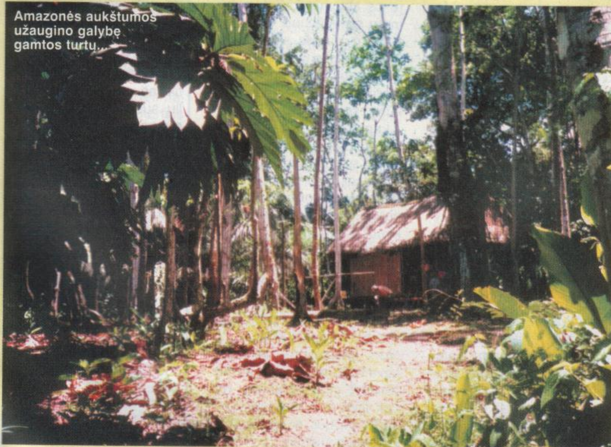
Amazonės aukštumos užaugino galybę gamtos turtu.

Parengta pagal “The Townsend Letter for Doctors“